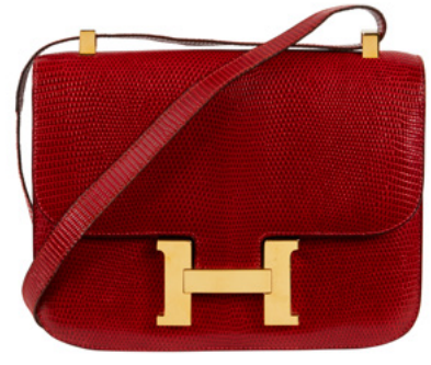
Hermès, Sac Constance 24 en lézard bordeaux Estimation : 8 000/12 000 €