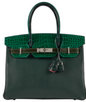
HERMÈS, 2017, Sac BIRKIN PATCHWORK 30 Crocodile d'estuaire, chèvre, taurillon Clémence, veau Epsom, Evercolor et box Vert Émeraude, Vert Titien, Vert Malachite, Vert Foncé et Rose Azalée Estimation : 25 000 - 35 000 €