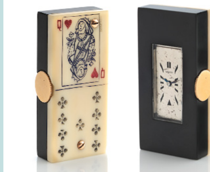
CARTIER "Queen of Heart & 9 of Clubs" Montre de sac en bakélite noir et ivoire peint Estimation : 3.500/4.500 €