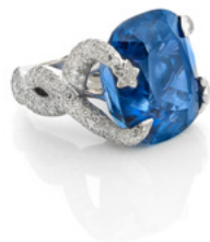
CHANEL Or, diamants et exceptionnel saphir 58.53 cts Estimation: 300 000 / 400 000 €

- Julie Valade, experte Joierie, Artcurial