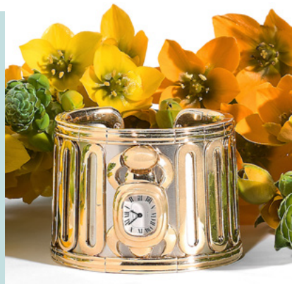
CARTIER Scarabée Montre manchette de dame en or jaune Estimation : 8.000/12.000 €

Le 8ème Opus du «Temps est Féminin» réserve de très belles surprises : Piaget, Van Cleef & Arpels, Boucheron, Audemars Piguet et évidemment Cartier, dont la côte ne fait que s'envoler pour les pièces anciennes et vintage... un ensemble raffiné, des pièces de collection de grande qualité.