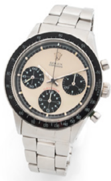
ROLEX Daytona «Paul Newman» Chronographe bracelet en acier Estimation: 120.000 / 180.000€