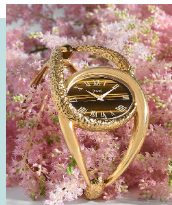
PIAGET Montre manchette en or jaune et œil de tigre Estimation : 8.000/12.000 €