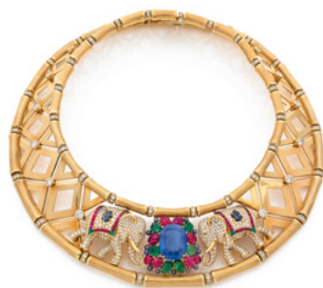
CARTIER «Bamboo» Or, diamants, rubis, émeraudes et saphir 30.79 cts Estimation : 80 000 / 120 000 €