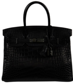
Hermès, 2010, Sac Birkin 30 So Black, alligator mat noir Estimation : 38 000/48 000 €.