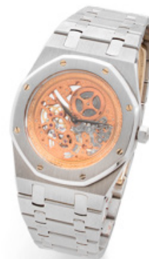
AUDEMARS PIGUET Royal Oak - Série Limitée en 5 exem- plaires Montre bracelet squelette en platine Estimation : 50.000/80.000 €