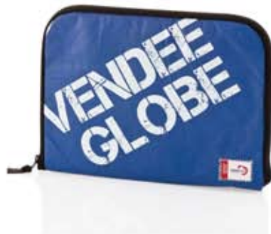
HOUSSE IPAD 10 POUCHES // 69€

727Sailbags sera présent au départ de la course du Vendée Globe aux Sables d'Olonne du lundi 31 octobre au dimanche 6 novembre 2016